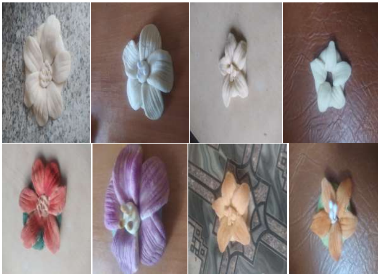
1- Самсонова Ангелина ,2- Маковеева Ксения,3-Кострюков Константин,4- Волохова Злата,5- Губенко Егор.